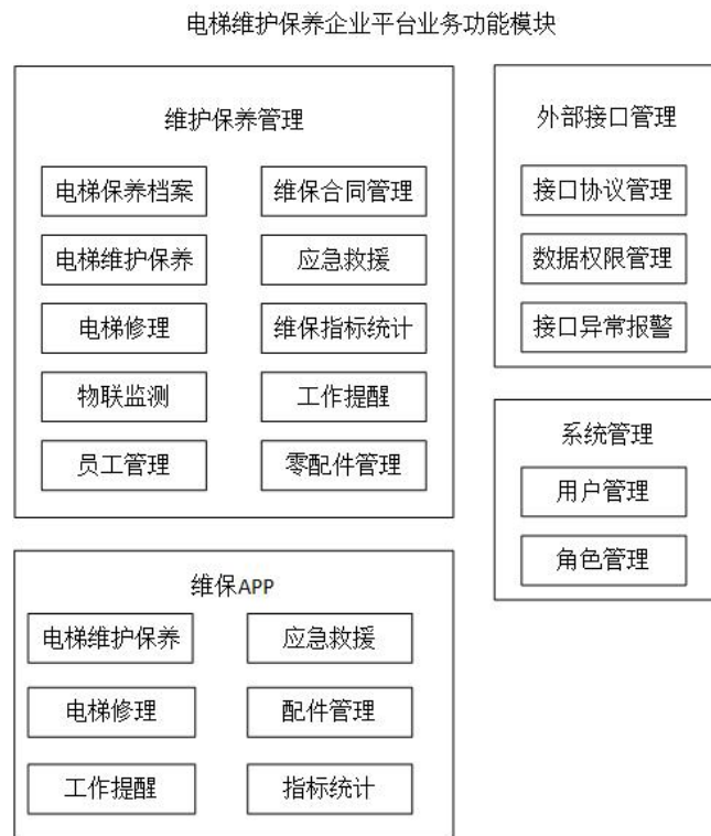
图 A.1 电梯维护保养企业平台业务功能模块